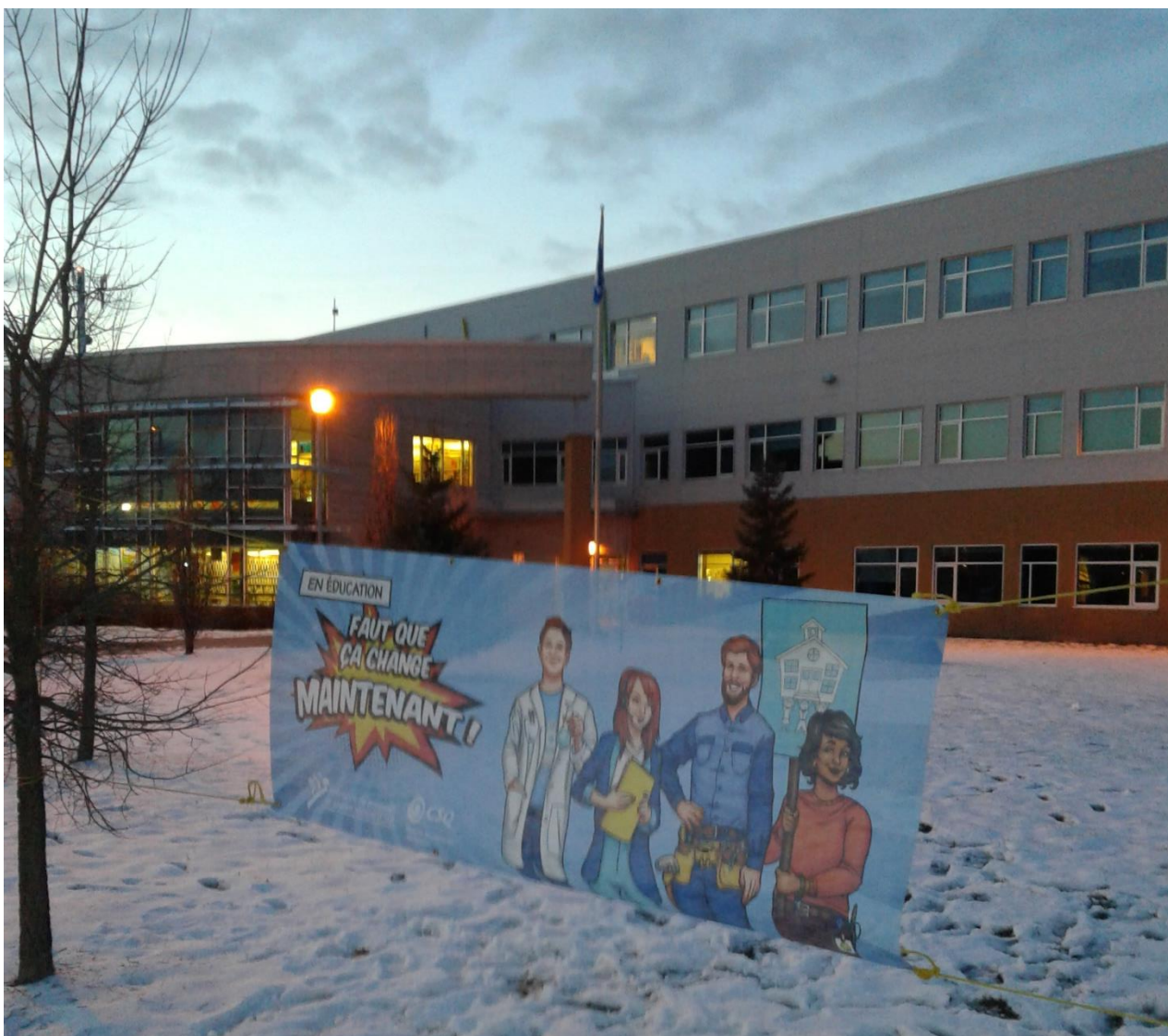
École secondaire de Mirabel

Voici le résultat monétaire de notre convention collective... Solidairement vôtre !